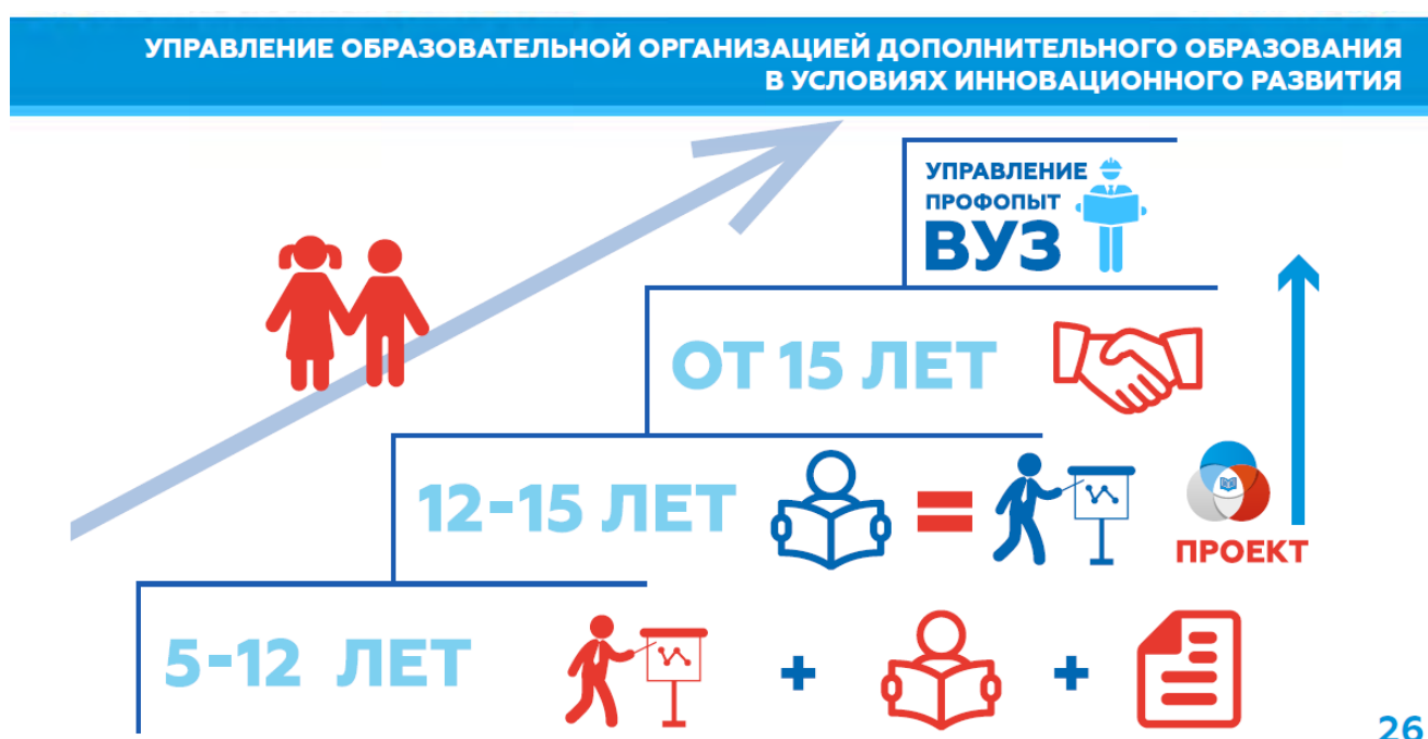
Рис. 2. Преемственность системы РДШ

Каждый подросток с 8 лет и до окончания школы может стать участником любого проекта РДШ, причем в большей части из них он может принять участие самостоятельно. Важным является непрерывность этой системы и возможность дальнейшей реализации на различных возрастных этапах (рис. 2.). Взрослый в РДШ – это тот, кто идет рядом, тот, кто готов подсказать и помочь, но не тот, кто выполняет все за ребенка. Этот принцип построения деятельности воспитывает в подростках самостоятельность и ответственность, уверенность и целенаправленность.